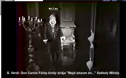
G. Verdi: Don Carlos Fülöp király áriája "Majd alszom én..." Székely Mihály