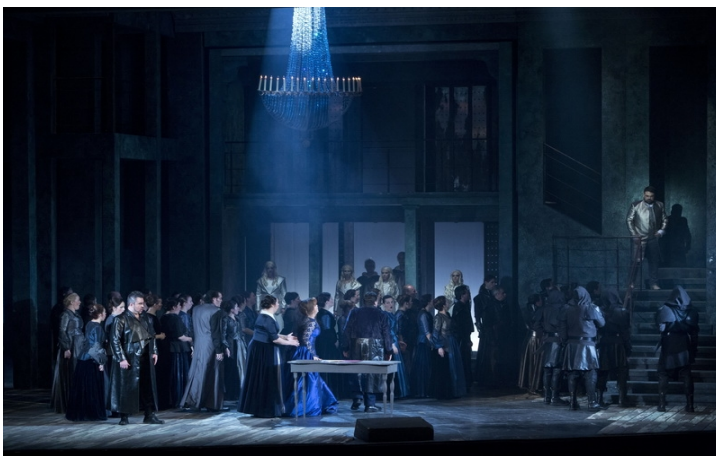
Az esküvő alatt megjelenik Edgardo!

A mai fellépésével azonban elkésett a művésznő, 68 éves és már nem tud ideális Lucia lenni! Mindazonáltal, ebből a koncertszerű előadásból, el lehet képzelni, hogy fénykorában milyen lehetett. Óriási siker aratott valóban. Igaz, hogy tele volt a színház csehekkel, szlovákokkal, akik aztán nem ismertek mértéket a brávózásban, de nem baj legalább ilyen jelenséget is átélhettem!