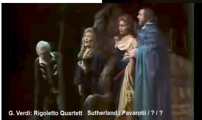
G. Verdi: Rigoletto Quartett Sutherland / Pavarotti / ? / ?