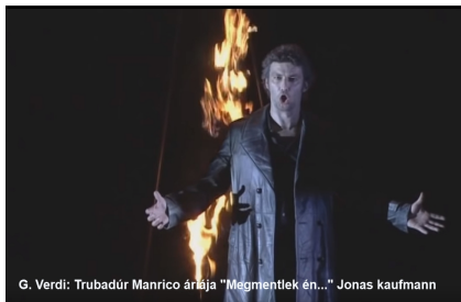
G. Verdi: Trubadúr Manrico áriája "Megmentlek én..." Jonas Kaufmann