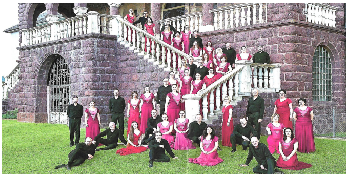
Közreműködött a Cantemus Kórus

Sajnálom, hogy a zenekar soraiból kipattanó táncosokról, akik „illusztrálták” a Tangó számot, nem találtam fotót az Interneten.